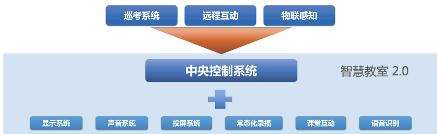
图2 浙大智慧教室建设标准

我们把上述场景固化成智慧教室的建设标准,并命名为“1+x”,如图2所示。“1”是以下七块:显示系统、声音系统、投屏系统、直录播系统、课堂互动系统及语音识别系统,最终通过中控系统对其进行管理,向上有三个可选系统:巡考系统、远程互动系统、物联感知系统,这样就形成了“7+3”共10个内容。